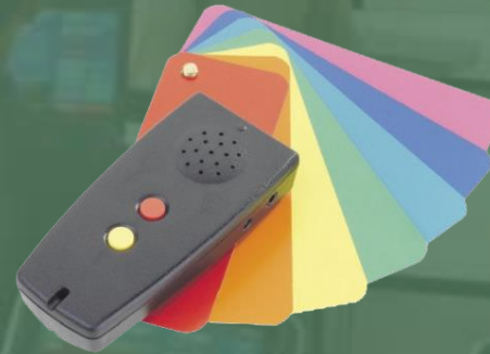
Identificador de Colores hasta 150 tonalidades