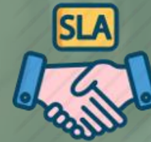
Cumplimientos de SLA