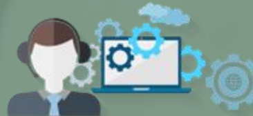
Soporte Nivel 2