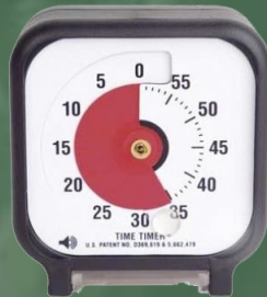
Timer Visual, su función es organizar y crear conciencia visual del tiempo