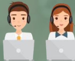
Soporte Nivel 1