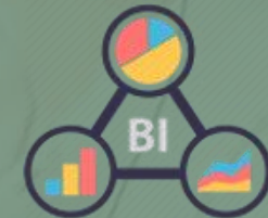
Inteligencia de Negocios