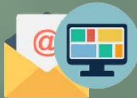
Email y Web